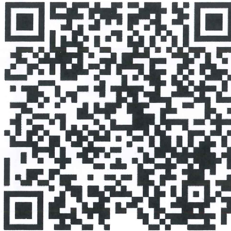
網路報名 QR code