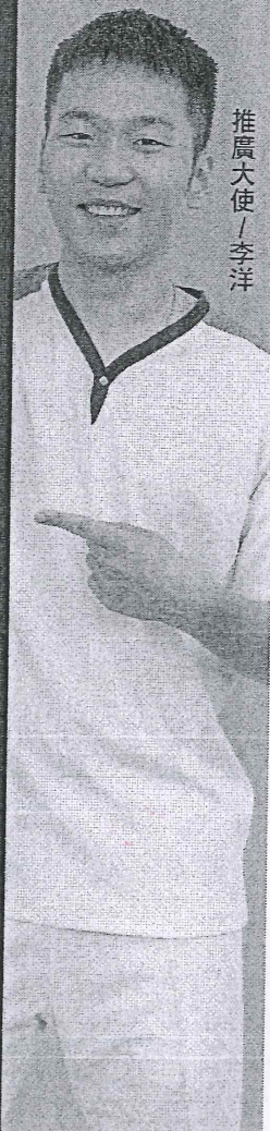
推廣大使 / 李洋